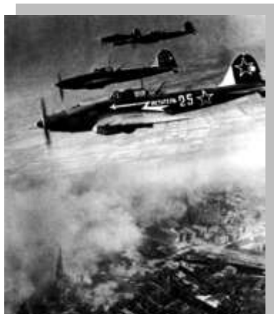
Во время войны Смоленская область имела стратегическое значение.