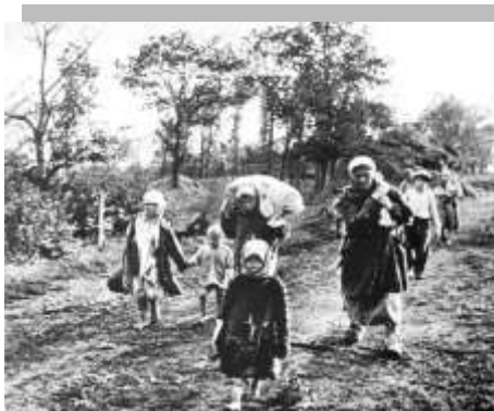
Летство. войной опалённое.

Воспоминания, старые фотографии дали возможность перенестись в то